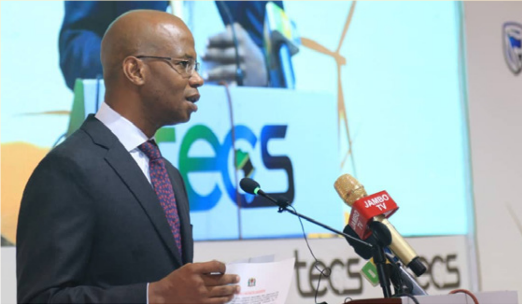
Waziri wa Nishati, Mhe. Januari Makamba akizungumza na wadau wa sekta ya Nishati Februari 01, 2023 mkoani Dar es salaam.

W aziri wa Nishati, Mhe. January Makamba amesema Tanzania imeweka milango wazi kwenye uwekezaji wa Sekta ya Nishati kutokana na uwepo wa mahitaji makubwa ya nishati nchini.