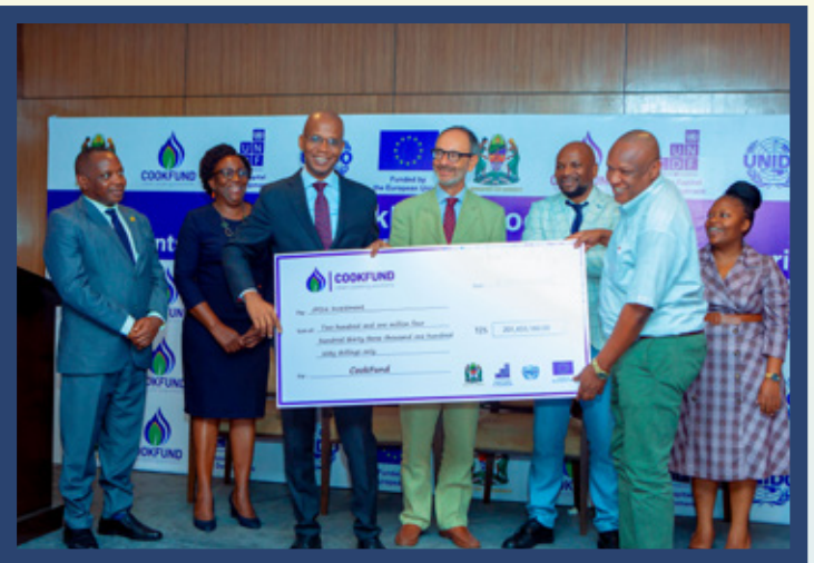
Waziri wa Nishati, Mhe. January Makamba akikabidhi hundi kwa baadhi ya wanufaika wa ruzuku ya Shilingi bilioni 3.21 iliyotolewa na Mfuko wa Nishati Safi ya Kupikia (CookFund) Tanzania kwa kampuni 16 zinazojishughulisha na utoaji wa huduma za uuzaji wa nishati safi ya kupikia nchini. Hafla hiyo ilifanyika mkoani Dar es Salaam.