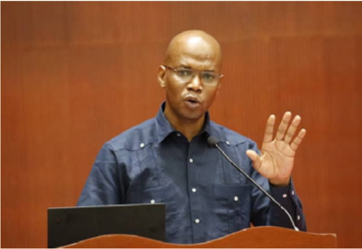
Waziri wa Nishati, Mhe. Januari Makamba akizungumza na Wakandarasi wanaotekeleza miradi ya umeme vijijini katika kikao maalum kilichofanyika Dar es Salaam, Januari 24, 2023.