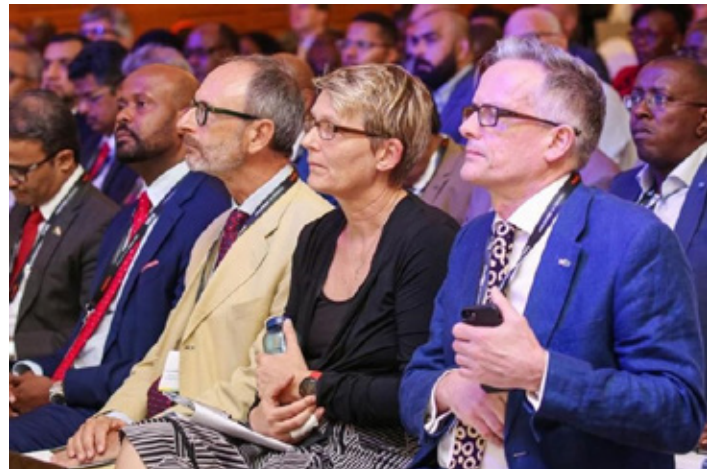
Wadau wa Nishati kutoka ndani na nje ya nchi wakimsikiliza Waziri wa Nishati, Mhe. Januari Makamba wakati wa Mkutano wa Tatu wa Wadau hao uliofanyika mkoani Dar es Salaam.