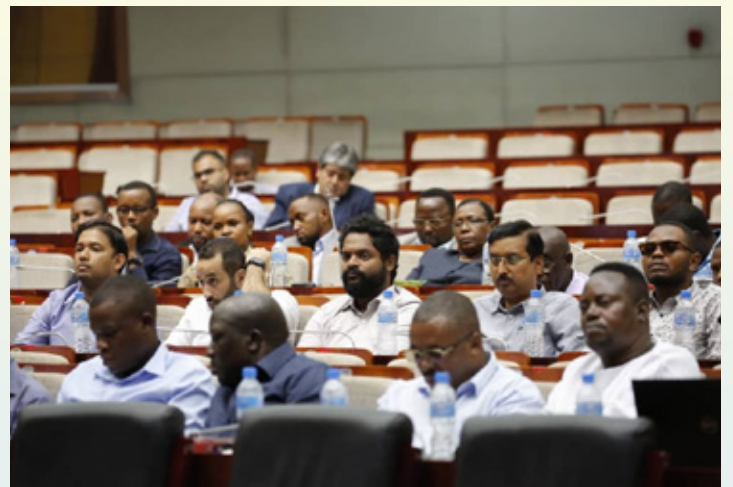
Sehemu ya Wakandarasi wanaotekeleza miradi ya umeme vijijini wakimsikiliza Waziri wa Nishati, Mhe. Januari Makamba alipokuwa akizungumza nao katika kikao maalum kujadili utekelezaji wa miradi hiyo. Kikao hicho kilifanyika jijini Dar es Salaam, Januari 24, 2023.